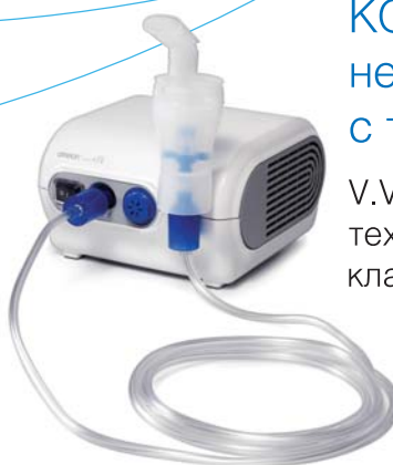
Comp AIR C28 (NE-C28)

V.V.T. (Ви.Ви.Ти.) – технология виртуальных клапанов